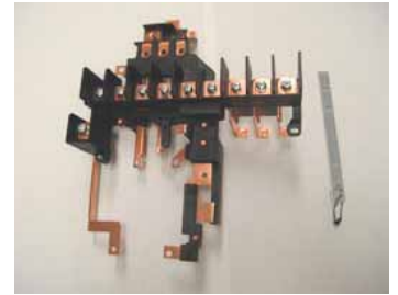
産業用配線導体付端子台 industrial terminal blocks with wire conductors

Integral molding terminal blocks with conductors which make it easier for our customers to assemble and decrease the pieces of parts. The shape of products can be changed in accordance with our customers' needs.