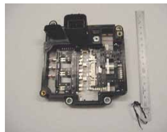
車載用ハイブリッドエアコン用ケース cases for hybrid air conditioners on a car

自動車用部品のjコネクター一体成形品です。その他、HEV、EV用の部品も対応いたします。